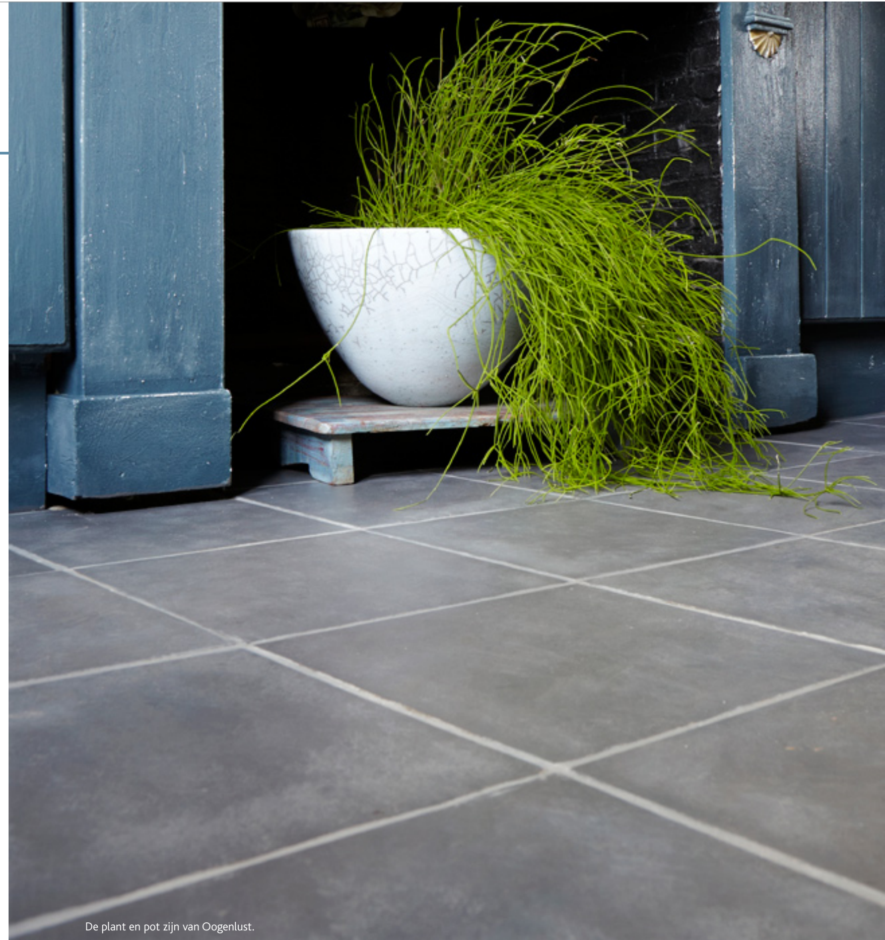
De plant en pot zijn van Oogenlust.

Carte Colori voor de verf ( www.cartecolori.nl )